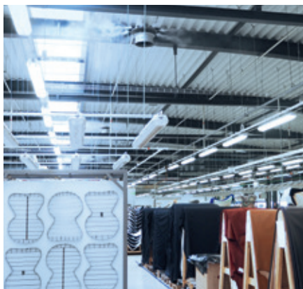
Regulacja wilgotności powietrza jest częścią systemu zarządzania jakością we Fritz Hansen