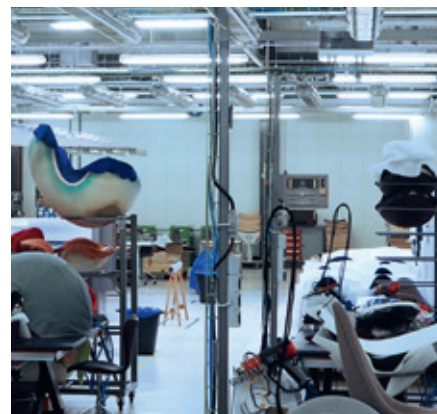
Względna wilgotność powietrza wynosząca 40% to gwarancja najwyższej jakości obróbki kształtowej

Condair Systems GmbH Nordportbogen 5 22848 Norderstedt Niemcy Telefon: +49 40 853277-0 Faks: +49 40 853277-44 E-Mail: info@condair-systems.eu Internet: www.condair-systems.pl