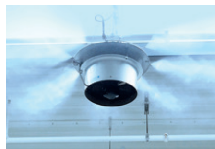
Wysokociśnieniowy nawilżacz powietrza ML Princess Condair Systems

Od 2013 r. produkcja mieści się również w Rawiczu: ponad 100 pracowników Fritz Hansen Production Sp. z o.o. specjalizuje się tu w wytwarzaniu wysokiej jakości krzesel. Na szczególnie wymagających etapach produkcji kontrolowany klimat pomieszczeń i monitorowana wilgotność powietrza odgrywają kluczową rolę w zapewnianiu jakości.